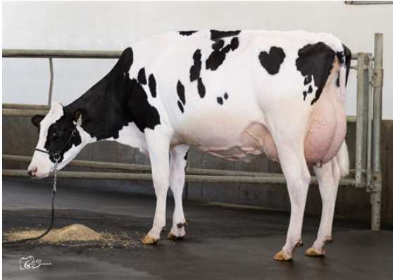
VERTDOR ALLIGATOR MIKA DAUGHTER