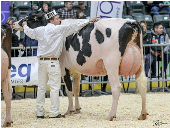
MODO ALLIGATOR LILO DAUGHTER